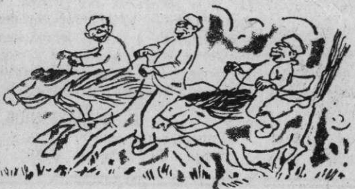
В. АГЕЕВ. На работу и с работы.