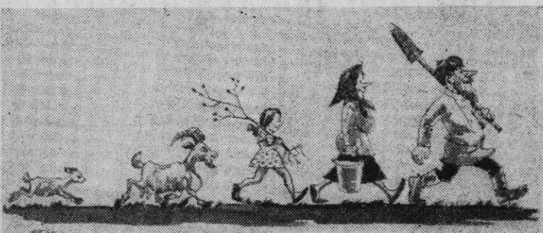
Г. ЯКОВЛЕВ. Любители зелени.

Карикатура — один из популярнейших в народе жанров изобразительного искусства. Юмор поднимает настроение, оружием смеха наш народ разит своих врагов, борется против пережитков прошлого. Именно поэтому выставка работ художников «Капкана», посвященная сорокалетию журнала, пользуется успехом у чебоксарцев. Ежедневно, а особенно в субботние и воскресные дни, здесь много зрителей, они с горячей заинтересованностью обсуждают достоинства и недостатки экспонированных работ, нишут свои замечания в книгу отзывов. И разве не приятно авторам, что на выставке нет равнодушных!