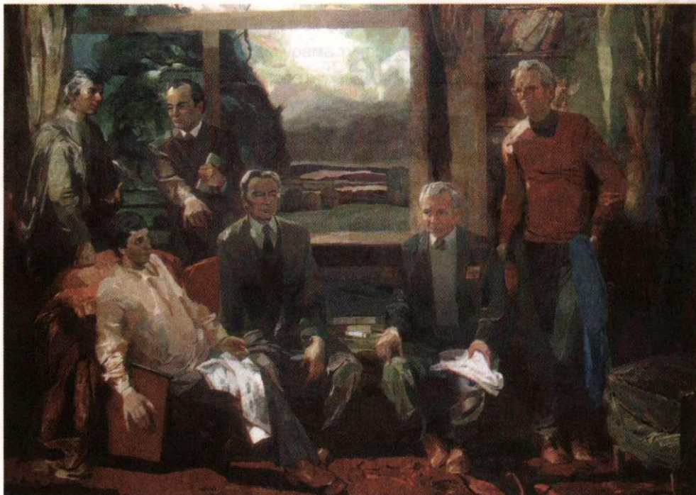
Малашлăх ҫинчен шухăшласа (чăваш ҫыравсисем). 1982 с.

Хальхи ҫамрăксен шăпи пăшăрхантарать мана. Таланта ҫул усма питӗ кансӗр. Пӗтӗмпе уксапа виҫесшӗн. Эпир яш чухне таланта асӑрхаса пулăшма тӑрăшатчӗҫ. Лабораторисем паратчӗҫ ӗҫлеме. Картинӑсене вӗсенче упрама май пурччӗ. Халӗ авӑ хамӑр укса-тенкӗпе тутарнӑскерсенех туртса илесшӗн хыпӑнаҫҫӗ. Ҫав лабораторисем вырӑнне пӗр-пӗр ҫевӗ фабрики уссан хула тупӑш ытларах илет имӗш. Чăваш халăхне нихăсан та ҫамӑл пулман. Эпир выҫӑллӑ-тутӑллӑ ўснӗ, хура-шурне пайтах курнӑ. Вӑрҫӑ айӑпне пула. Вӗреннӗ чухне пурӑнмалли кӗтес ҫукран путвалсенче ҫӗр каҫаттӑмӑр. Чӑтнӑ. Чăваш ятне ҫӗре ўкермен. Хальхи ҫамрăксене те чӑтӑмлӑ пулма сунатӑп.