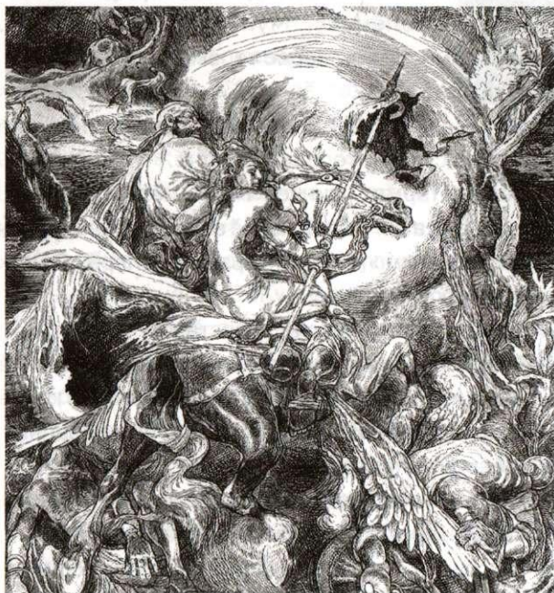
Авалхи чăвашсем. 2003 җ.

пулас. Куракансем час-часах килѣштересѣ ман геройсене.