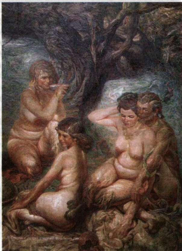
Мучи шуйттансем патĕнче хăнара. 1980 с.

А. Картинăра мучи манăн тискер мар. Урисем те ҫыннах, анчах ҫўҫ айĕнче икĕ мայрака палăрать. Аллегорически кунта. Пĕр ҫырмара шыва иккĕ кёме ҫук тенĕ пекех лайăх картинана