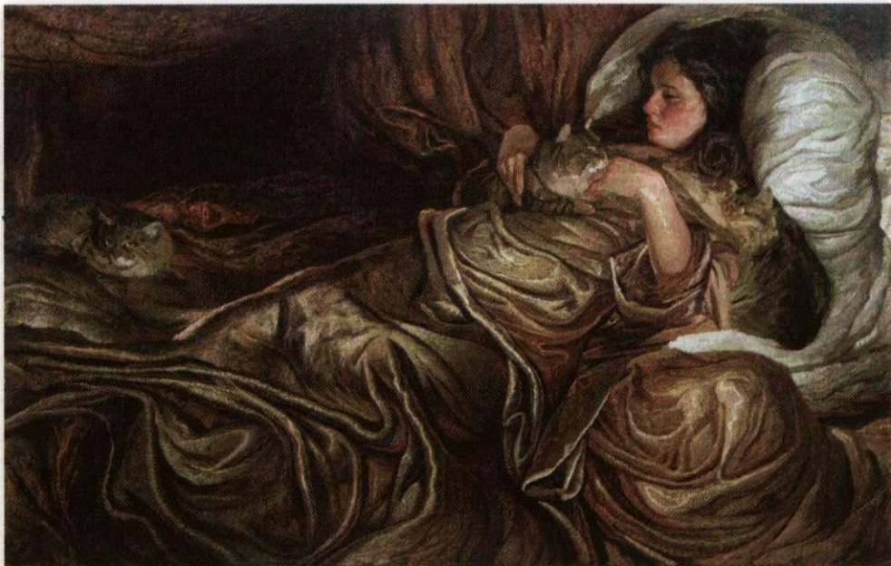
Анна кушаксемпе. Фрагмент. 1982 с.

Хёраpам въл – пурнăç пуçламăшĕ, пурнăç тыткăчи – ун аллинче. Аллинче тени тивĕштерсех те ҫитереймест – унăн ыpă кăмăлĕнче.