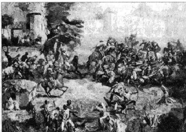
Ил. 9. Битва у стен города Сувар. 1985–1989 гг. Холст, масло. 147х200. ЧГХМ

В картине «Защитники г. Биляр – столицы Волжской Булгарии» изображен захват города монгольским войском в 1236 г., после чего он был разрушен (в связи с набегами и грабежами Болгара со стороны Владимиро-Суздальского княжества в XII в. столицу Волжской Булгарии перенесли в Биляр – «Великий город»). Трагизм исторического события подчеркивает несколько моментов, детально прописанных художником. Группа воинов в центре еще находится в пыли боя, к ним сквозь разрушенную стену спешат новые захватчики. В правом нижнем углу среди обломков каменных памятников старец пытается спасти толстые рукописи – так показана духовная составляющая жизни древних биляр. В противоположном углу лежат павшие бойцы, рядом пленные девушки обреченно ждут своей участи... Таким образом, Агеев старается более полно раскрыть все неприглядные грани поражения.