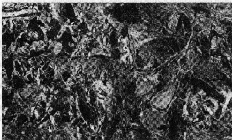
Ил. 6. Молэ – предводитель гуннов. 235–174 гг. до н.э. 2017 г.