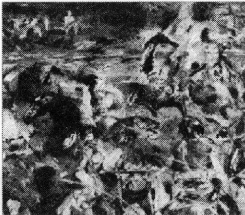
Ил. 7. Волжские булгары. 2014 г. Бумага. 43x48. ЧГХМ