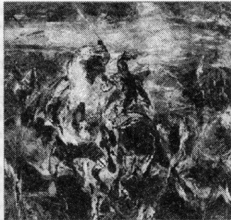
Ил. 8. Поединок из серии «Волжские булгары». 2016 г. Бумага. 58x60. ЧГХМ

Самой необычной в этом ряду, как по компоновке, так и по цветовому решению, является работа «Поединок» (2016) (ил. 8). Автор изображает кульминационный момент в геометрическом центре, а не «разбрасывает» персонажей по всему пространству картины. Лист производит очень мощное впечатление – конь, вставший на дыбы, словно вот-вот раздавит зрителя, оказавшегося у него под копытами. Этот «взгляд снизу», динамическая направленность вперед формируют реально ощутимую волну, выходящую за пределы плоскости изображения. Усиливает это ощущение и экспрессивная манера письма, умышленная дисгармоничность колорита (большие черные, грязно-голубые, охристо-белые цветовые массы с пунцовыми вкраплениями), и излюбленный автором прием вихревого фона – когда он условен, но ощутим. Пожалуй, это одно из лучших произведений художника в данном жанре.