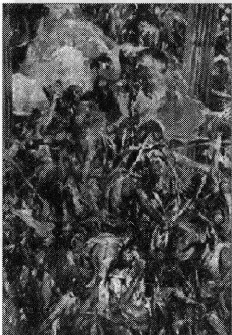
Ил. 4. Армия Аттилы в Константинопольском поле. 1994 г. Бумага. 47x36,5. ЧГХМ

В 2016–2017 гг. на пике своего интереса к историческому персонажу художник посвящает ему серию картин. Центральным полотном в ней является «Аттила – император гуннов. 451 г. Север Италии» (2017). Завоеватель в золотых доспехах, восседающий на коне, представлен на фоне своего войска. Задний план обобщен, что фокусирует внимание на его фигуре. Автор создал выразительный образ, подчеркнув орлиный профиль лица.