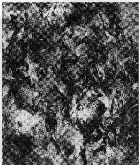
Ил. 2. Крестьянская война в Чувашии в 1774 г. 2011 г. Холст, масло, 70х58. ЧГХМ

ческому событию и эпохе. Художника по-прежнему увлекает хаос сражения, его динамика и живописность. Данные характеристики предельно усилены в картине «Гражданская война 1918 года» (2009). Это чистая «гравитация» в том виде, как понимает сам мастер. Движение, которое он пытается передать на холсте, настолько мощное и стремительное, что человеческий глаз не успевает его зафиксировать, поэтому вся сцена словно сливается в единое пятно. Едва видимые фигуры переходят в фактурные мазки, их сплетение передает агонию войны.