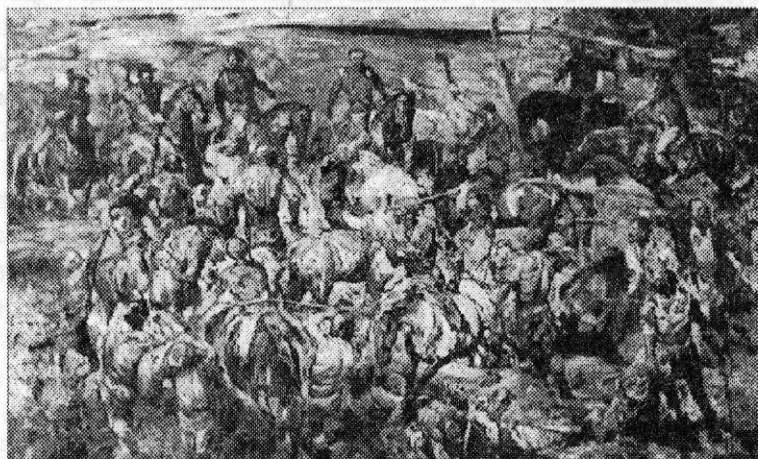
Ил. 1. За власть, за землю. 1982 г.

Анализ трех произведений «За власть, за землю» (ил. 1), «Крестьянская война в Чувашии в 1774 г.» (ил. 2), «Гражданская война 1918 года» (ил. 3) показывает развитие творческой мысли Владимира Ивановича на протяжении трех десятилетий и то, как менялись композиции и способы изображения батальных сцен.