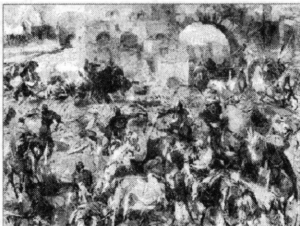
Ил. 10. Битва за город Сувар. 1237 год. 2005–2006 гг. Холст, масло. 80х100. Союз художников Чувашии

В картине «Защитники г. Биляр – столицы Волжской Булгарии» изображен захват города монгольским войском в 1236 г., после чего он был разрушен (в связи с набегами и грабежами Болгара со стороны Владимиро-Суздальского княжества в XII в. столицу Волжской Булгарии перенесли в Биляр – «Великий город»). Трагизм исторического события подчеркивает несколько моментов, детально прописанных художником. Группа воинов в центре еще находится в пыли боя, к ним сквозь разрушенную стену спешат новые захватчики. В правом нижнем углу среди обломков каменных памятников старец пытается спасти толстые рукописи – так показана духовная составляющая жизни древних биляр. В противоположном углу лежат павшие бойцы, рядом пленные девушки обреченно ждут своей участи... Таким образом, Агеев старается более полно раскрыть все неприглядные грани поражения.