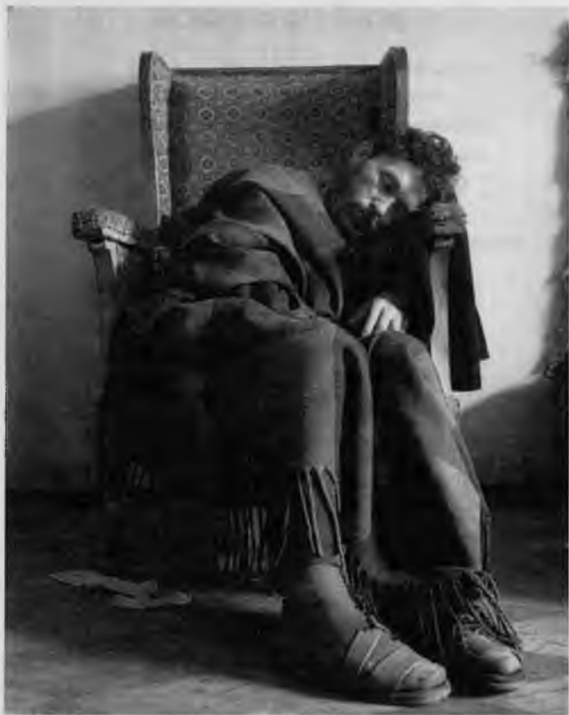
Игорь Макаревич Сон и поэзия (портрет Геннадия Айги) 1969