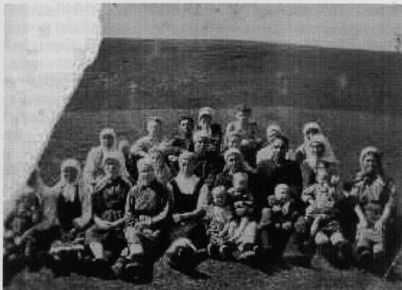
ял пӗвине тӑвакансем (1950 - мӗш сүлсем)

колхоз та «Прогресс» сүмне пёрлешнӗ, ку сүлах Пӗчӗк Супарсене те вӗсем хайсен йышне илнӗ.