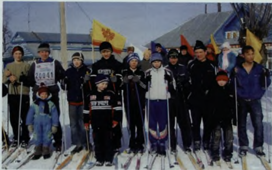
Лыжня соревнований, 2006 г.