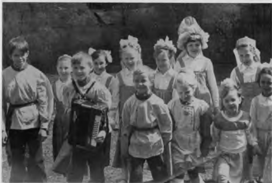
Детский коллектив художественной самодеятельности, 1990 г.