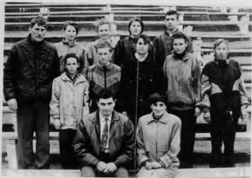
Участники Московского международного марафона мира 1991, 1992, 1993, 1994 гг.