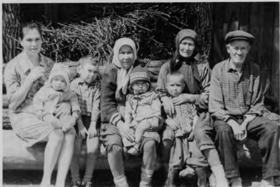
Жители ул. Мира, 1970-е гг.