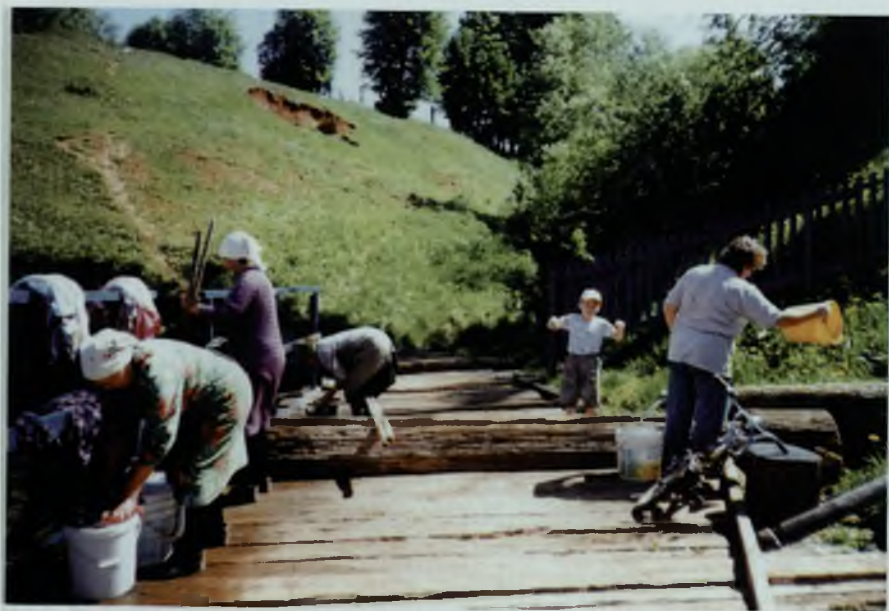
Родник «Мән җәл», 2011 г.