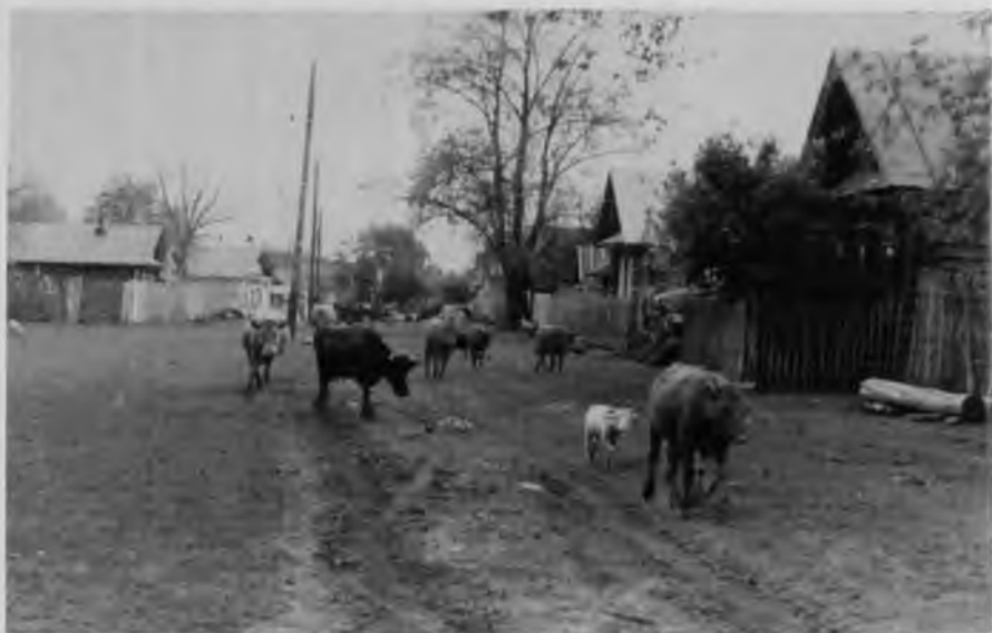
Ул. Мира 1970-е гг.