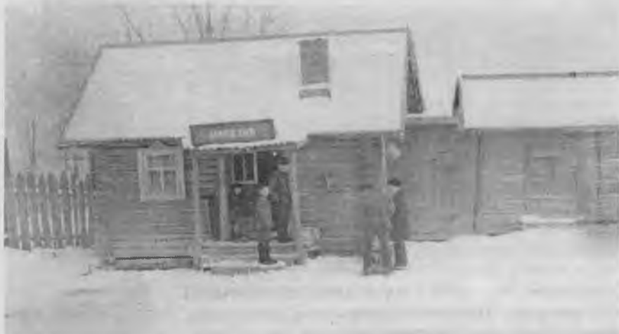
Магазин, 1970 г.