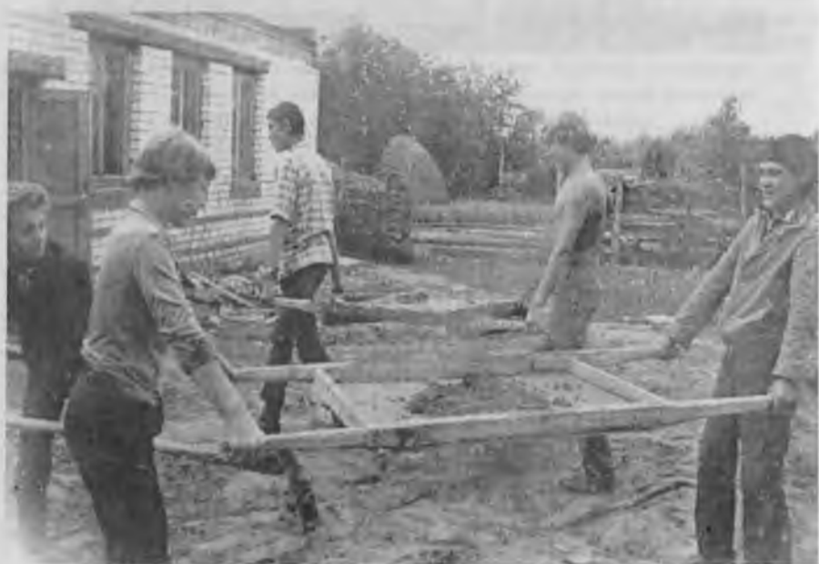
Строительство клуба, 1983 г.

В клубе постоянно проводятся различные мероприятия для людей разного возраста. Вошло в традицию проведение: праздника деревни, новогоднего утренника и бала-маскарада, Рождества Христова, проводов зимы, осеннего бала; КВНов. Специально для детей проводятся вечера игр, различные конкурсы, а для молодежи танцевальные вечера и другие развлекательные мероприятия.