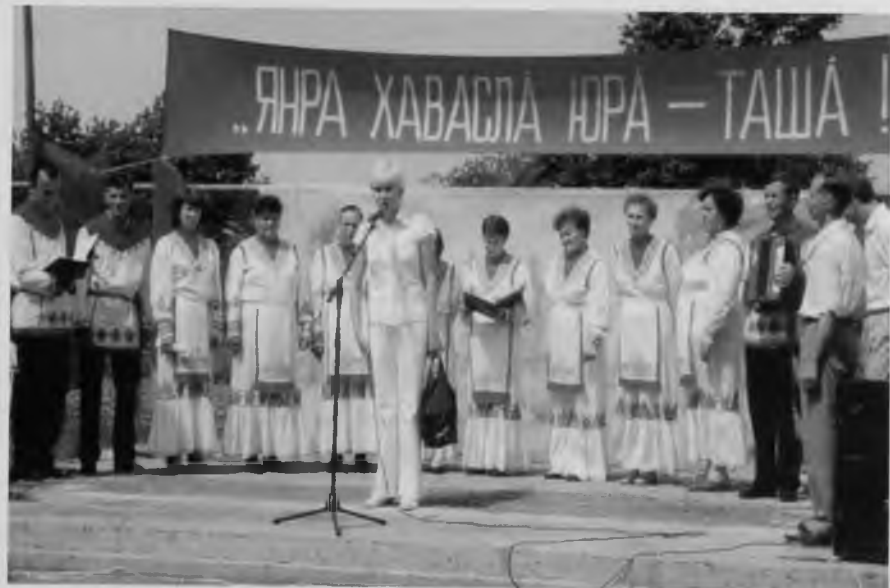
Праздник деревни, 2003 г.