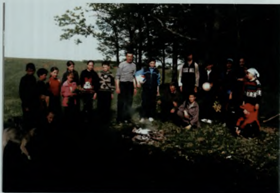
Турпоход «Край наш родной», 2003 г.