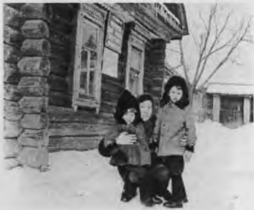
Здание Тохмеевского сельского клуба, 1982 г.

В 1951 году после воссоединения колхозов «Культура» (д. Тохмеево) и «Победа» (д. Шоркино) бывшее пятистенное деревянное здание правления колхоза «Культура» переоборудовали под сельский клуб.