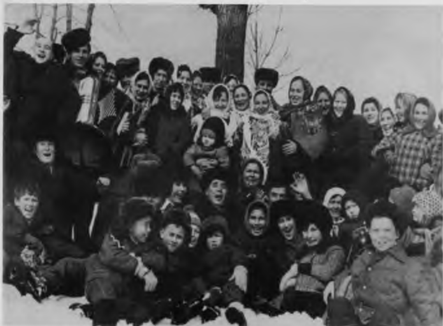
Проводы «Русской зимы», 1982 г.