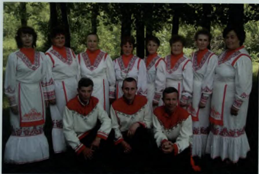
Коллектив художественной самодеятельности, 2003 г.