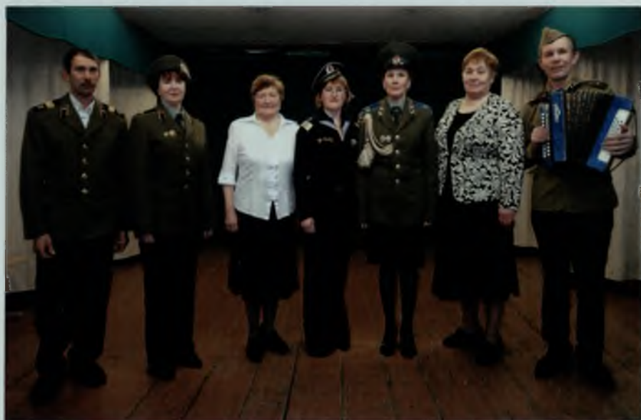
День защитника Отечества, 2013 г.