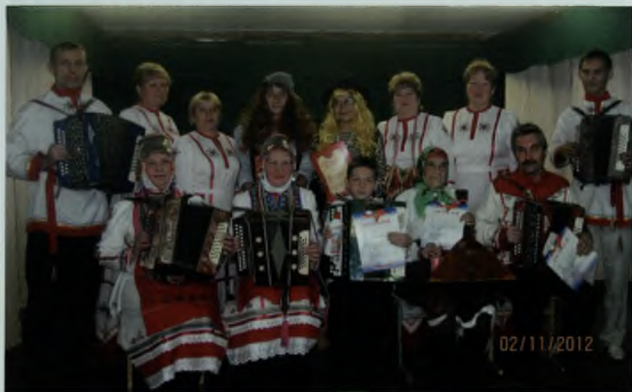
Играй гармонь, 2012 г.