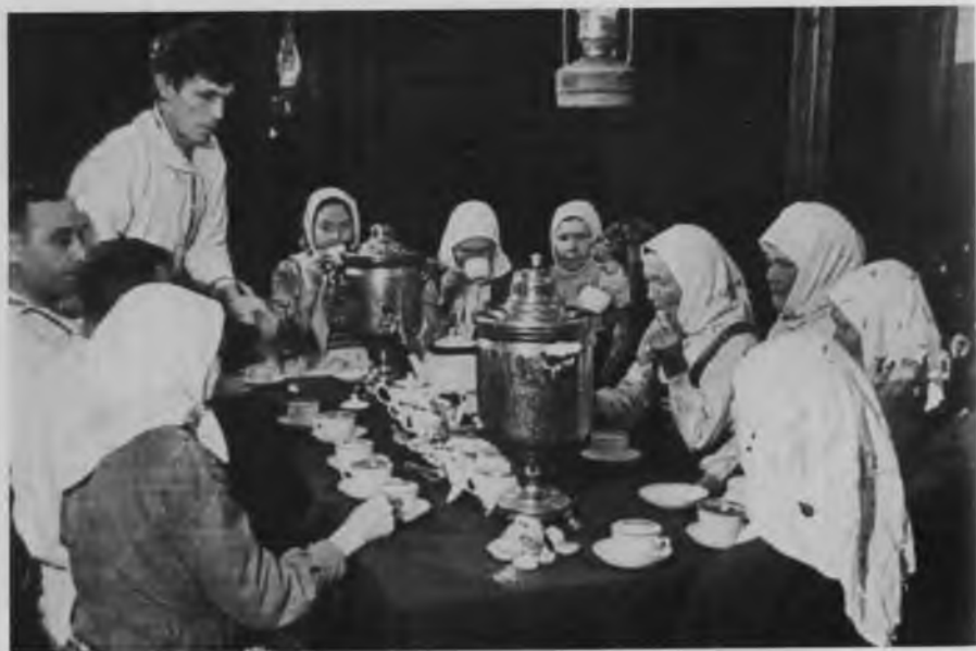
Рождество Христово, 1986 г.