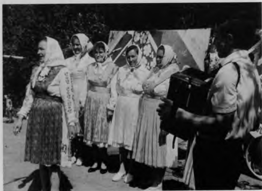
На совхозном празднике «Акатуй», 1990 г.