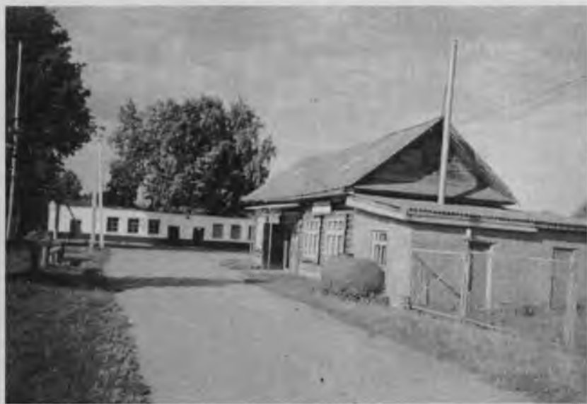
Тохмеевский сельский магазин и Тохмеевский сельский клуб, 2007 г.