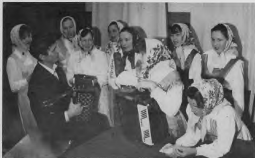
Коллектив художественной самодеятельности, 1993 г.