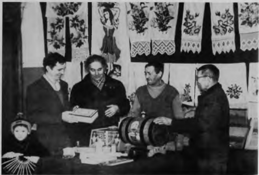
Выставка декоративно-прикладного искусства, 1992 г.