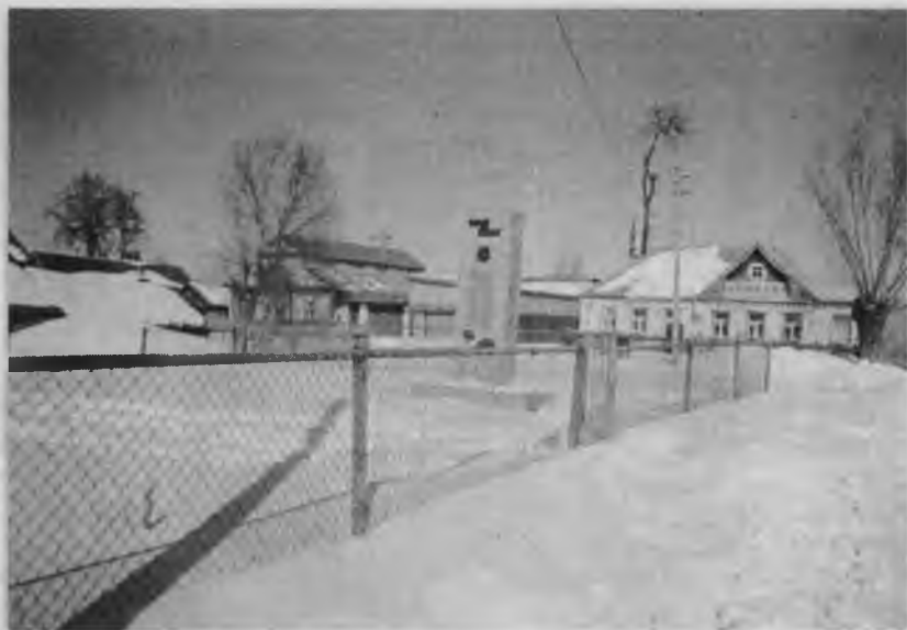
Памятник погибшим односельчанам в Великой Отечественной войне 1941-1945 гг.