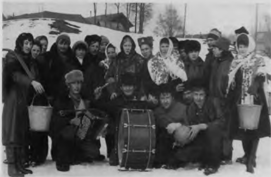
Проводы «Русской зимы», 1987 г.