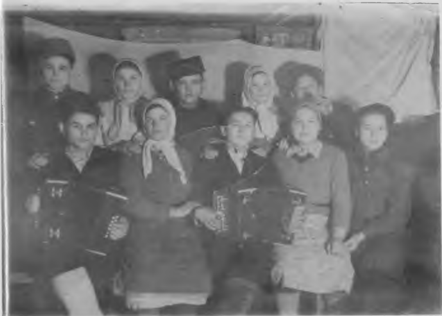
«Красные» поселелки, 1950 г.