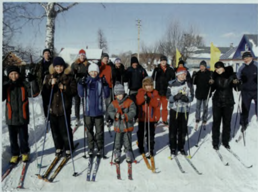
Лыжня России, 2013 г.