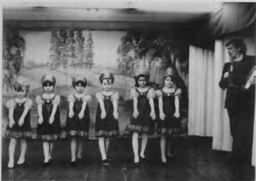
Детский коллектив художественной самодеятельности, 1997 г.