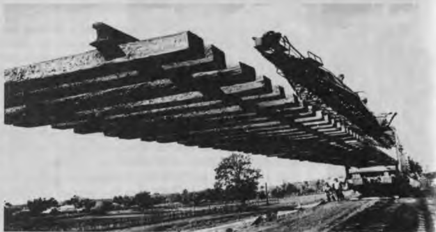
Укладка железнодорожного звена около деревни Тохмеево 1999 г