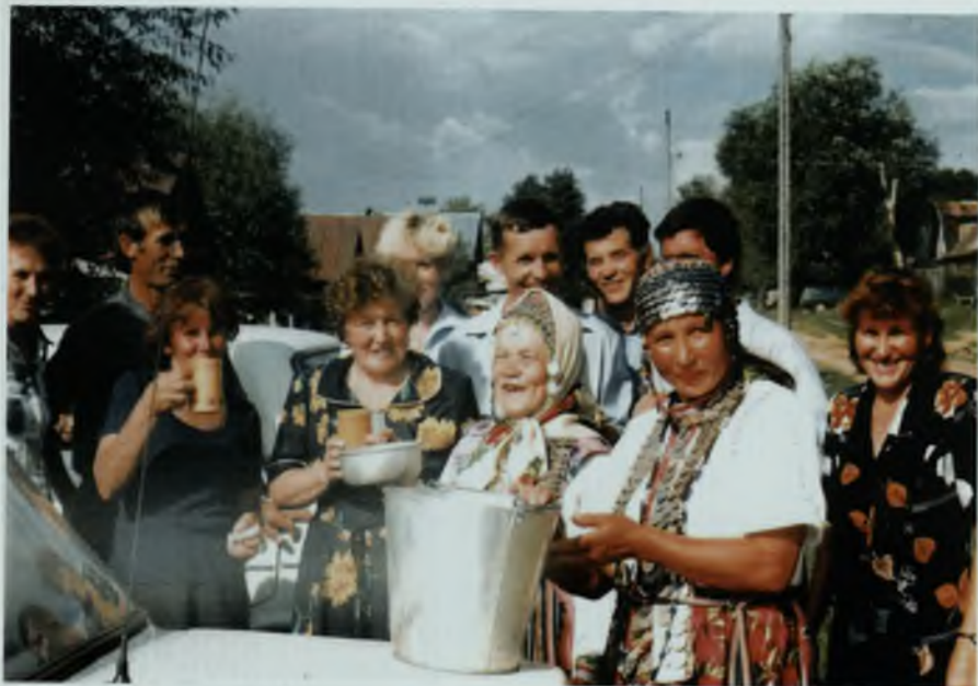
Праздник малой деревни, 2000 г.