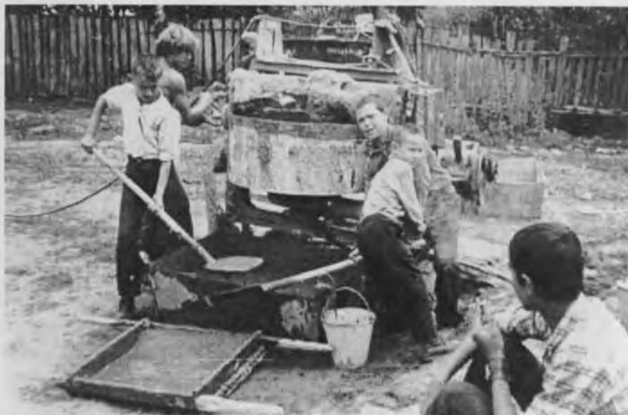
Растворо-бетонный узел, 1983 г