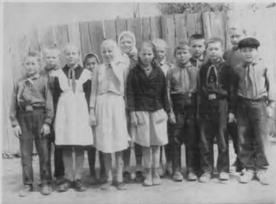
Учащиеся Тохмеевской начальной школы, 1964 г.