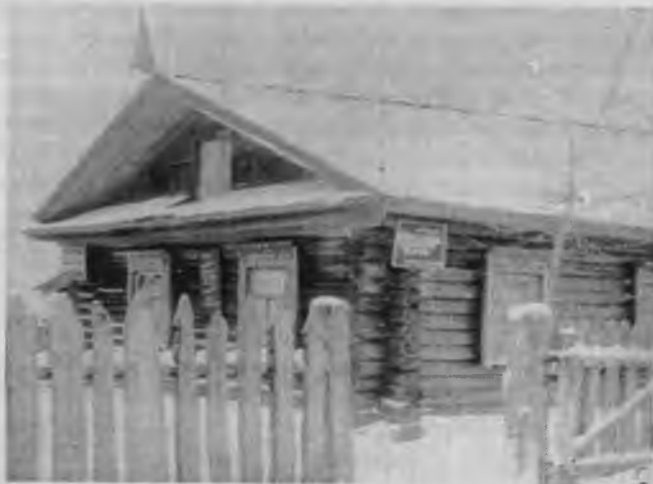
Здание начальной школы (с 1968 г – сельский клуб)

По архивным документам, в 1920 году заведующим избой-читальней в деревне Тохмеево был К. Иванов. По рассказам старожилов, в здании начальной школы днем учились дети, а вечером собиралась молодежь на «красные» посиделки.