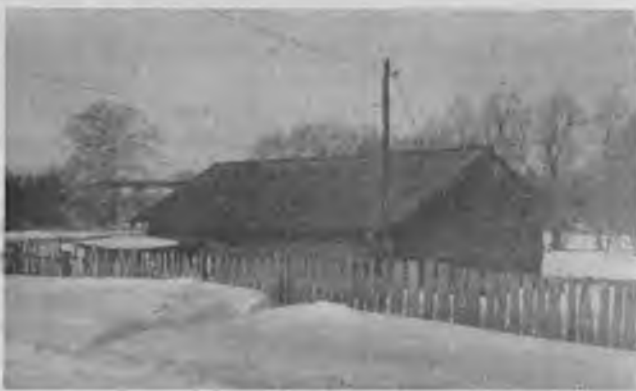
Бывшее правление колхоза «Культура» - зерновой склад колхоза «Звезда»

В 1973 году бывшее здание сельского клуба переделали под зерновой склад колхоза «Звезда», а в подвальном помещении хранили колхозную картошку.