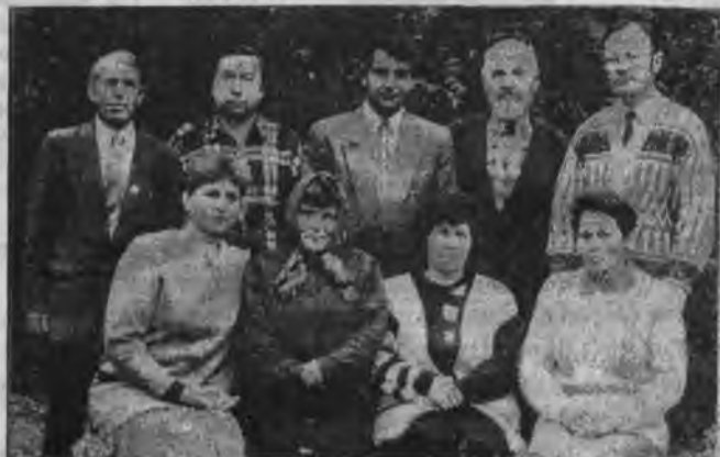
Коллектив редакции райгазеты. 1998 г.