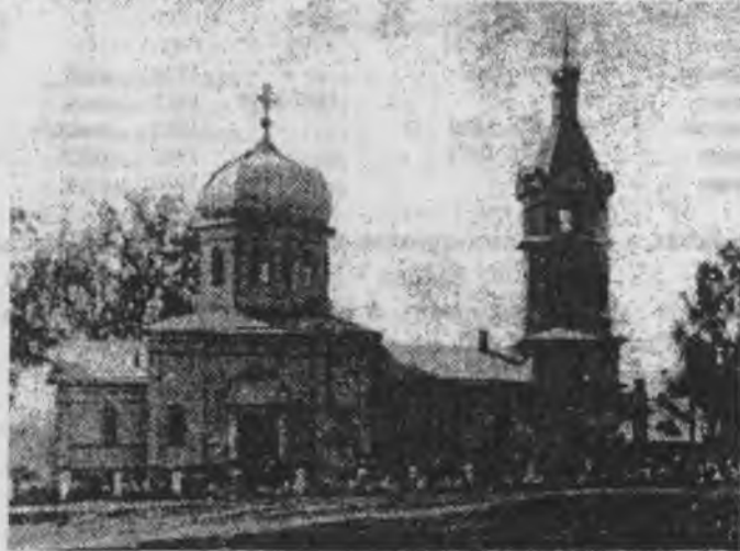
Штанашская деревянная церковь, построенная в 1873 году. Сломана в 1985 году. Снимок 1960 года (с северной стороны).

В начале 19 века (1801) в Чебоксарском, Цивильском, Тетюшском, Козьмодемьянском и Ядринском уездах Казанской губерний, в Буинском и Курмышском уездах Симбирской губерний, то есть на территории современной Чувашии, сельских школ не было. Открытие первых школ в чувашских селениях связано с деятельностью Казанского университета, организованного 1804 году. Хотя, согласно уставу учебных заведений, в сельской местности разрешалось, под контролем духовенства, открывать церковно-приходские училища, но в некоторых местах всячески старались помешать этому течению. Ссылались на то, что для чуваш просвещение вредно, ибо они забудут земледелие. Но, несмотря на все препятствия, 10 августа 1807 года в селе Буртасы Цивильского уезда (ныне Урмарский район) открылась первая сельская школа, которая просуществовала с перерывами до 1828 года. Вторым учебным заведением явилось Красночетайское сельское приходское училище Курмышского уезда, которое было открыто 1 мая 1819 года. Там обучали чувашских детей чтению и письму на русском языке. Подобная школа открылась 2 ноября того-же года в селе Шихазаны Цивильского уезда (ныне Канашский район) и чуть позже в д. Малый Сундырь, которая входит теперь в состав Чебоксарского района.