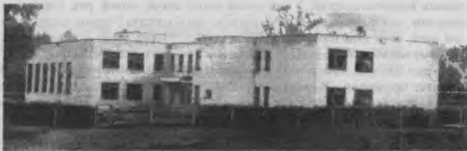
Большемашевская средняя школа, построенная в 1994 году.