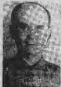
Учитель, совет. дипломат в МНР Галкин Т.Н.