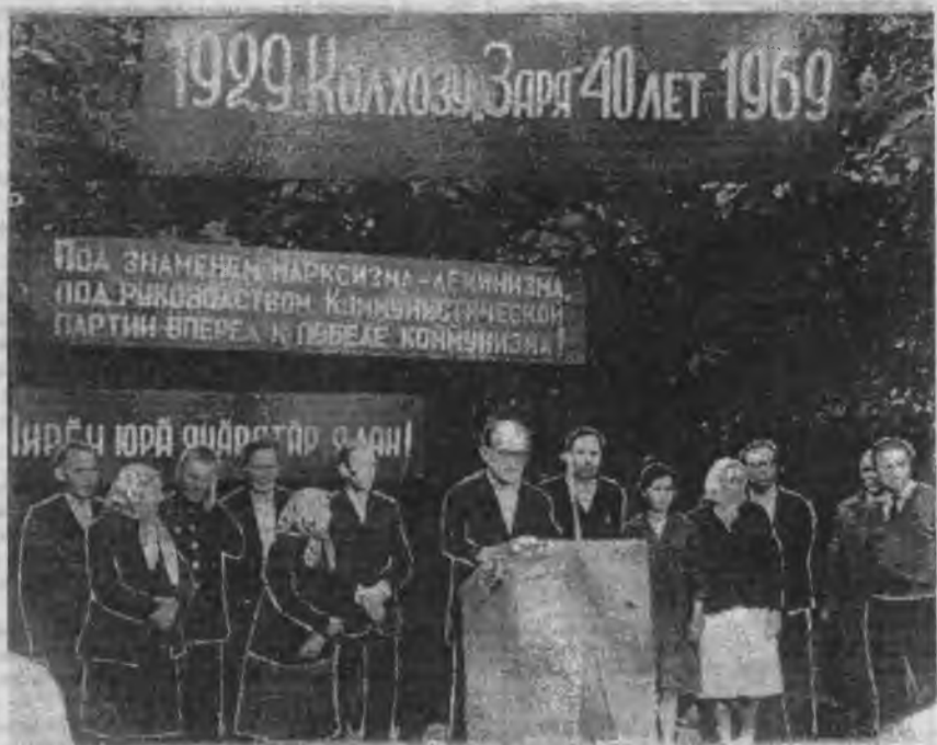
Торжественное мероприятие Большеямашевского колхоза «Заря» в июне 1969 года.

с. Юманлыхи - «Дубняк» - 1930 д. Ягунькино - «Маяк» - 2.04.1929 д. Яргунькино - «Луч» - 2.04.1929 д. Ярушкино - «Фонарь» - 1930 д. Яжуткино - «Красный пахарь» - 1931 д. Якейкино - «Пробуждение» - 1929 д. Янгорас - «Дуб» - 26.03.1929 с. Яндоба - «Алмаз» - 19.08.1930 д. Яныши - «Красная Сорма» - 1929