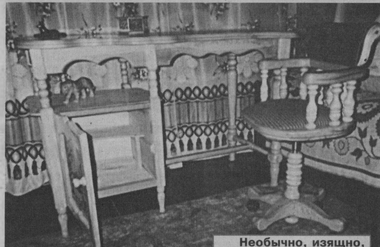
Необычно, изящно, красиво...

вещи нигде не встретишь, они в единственном экземпляре. Мою восхищению от увиденного не было предела. В каждом изделии чувствовалась изюминка, наверное, потому что мастер вложил в них частичку своей души, много старания и усердия.