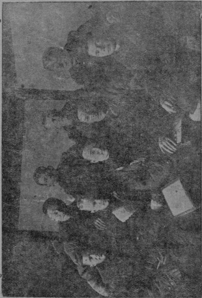
Экипаж самолета «Голубая двойка», в центре — Герой Советского Союза Ф. Н. Орлов. С этим экипажем летал легендарный Гастелло.