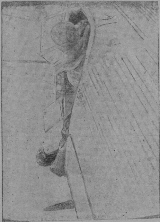
Герой Советского Союза капитан Ф. Орлов перед вылетом.