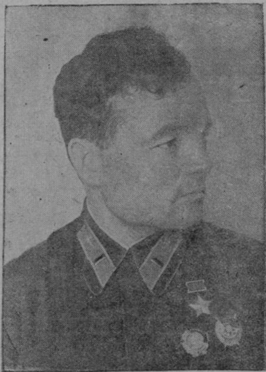
Герой Советского Союза капитан Ф. Орлов.