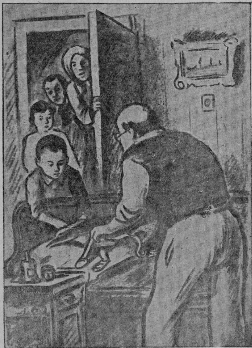
Телёр кун иртсенех пётём Почта урамё Карл Петрович мулкача сыватни җинчен пёлчө.