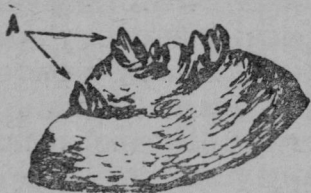
Рис. 4. Яровизированная верхушка: А — ростки

ного количества верхушек клубней картофеля, идущего на питание, ни в коей мере не должна ослабить борьбу за заготовку, засыпку и бережное хранение семенных клубней картофеля для обеспечения