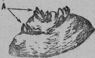
4-меш үкерчәк. Яровизациленә җәрулмин тәрри. А—җәрулми сәмсаланни.

Җакна җирәп асратытмалла: җәрулмин тәррине касса вәрләх хатәрлени—план тәрәх лартманә җәр лаптакә валли кирлә җәрулми вәрләхә хатәрлесе, типтерлә сыхласа усрасәҗе пәре те чакармал-