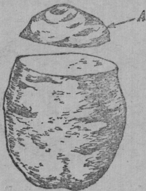
2-мӗш ӱкерчӗк. А — каснӑ тӑрӑ.

лӑх пулса тӑраҫҫӗ. 150—200 грамм турта- кан пысӑк ҫӑрулмин тӑрринчен 15 грамм пы- сӑкӑш ҫуптӑк касса илмелле. 100 грамм туртакан ҫӑрулми тӑрринчен 5—10 грамм йывӑрӑш ҫуптӑксем касса илмелле. Ҫӑрул- мин папаккисем пулсан, унӑн кашни па- паккинченех ҫуптӑк касса илмелле.