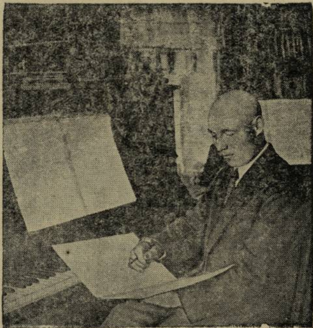
Ф. П. Павлов 1892 — 1931