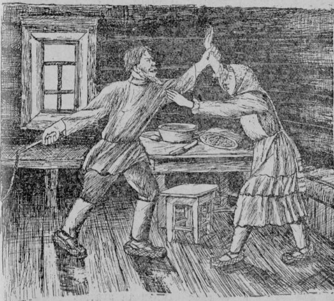
Ырă кӧрү Тăхтаман буллен кунах арăмне саламатпа кастарай.