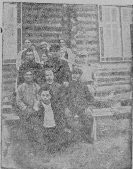
Соловай тунә җерте ёҗленё утарнай прикатә.

тем-те-пёр таваканни те пур. Вёсем ёҗсленине курсан җун саванаҗ. Җанахах та сотсиалисам таватпәр тетён. Ирёксёрех җавартан тухаҗсё җав сәмахсем. Астан сававас мар, аҗтан кә-