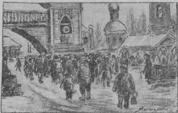
ХвеҶукпа ашшё те хапха патне пыҶёс.

— Йут патшаләхсемпе Совет Союсё пурняҶё ҶинҶен Авқсентйёв йулташ каласа парат, терёҶ каллех ма́н сася.