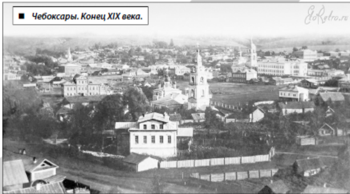
■ Чебоксары. Конец XIX века.